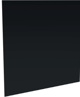
MÉTAL (PLEIN OU PERFORÉ)