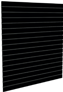
SLATWALL SANS INSERTIONS D'ALUMINIUM